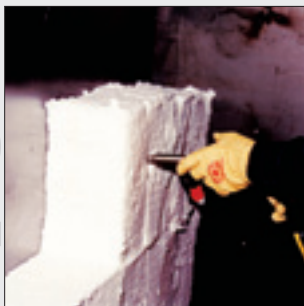
파이로-블럭 스타트건을 알루미늄 튜브에 밀어 넣고 건을 작동시키면 순간응집 및 자동드릴이 3초내에 작동한다.