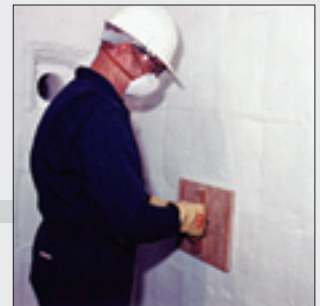
전체 시공이 끝난 후 패널을 이용하여 다진다.