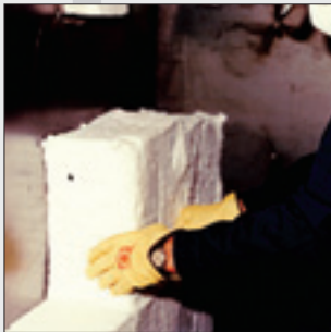
로 철판에 이물질이 없애고 파이로-블럭을 압축하여 댄다.